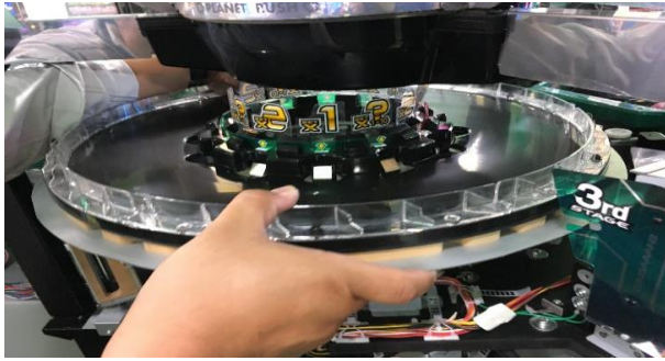
①3rdステージを取り外す