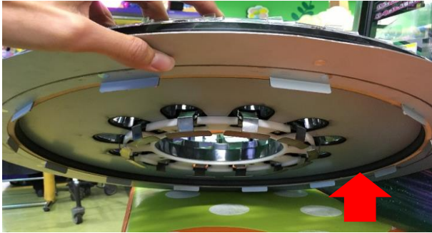
②3rdクルーンの裏側にある ドライブモータの接触面の汚れを確認